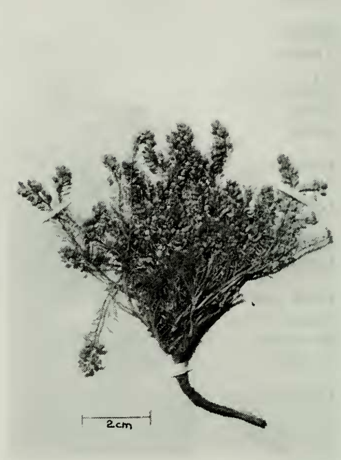
FIG. 4. Lepidium brevicaule . Jiles 6384. Cordillera de Ovalle, 2300 ms.m. (CONC).